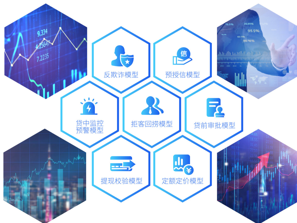
提供多种模型咨询服务和联合建模服务

模型与知识图谱配合，与规则互补，因此，以机器学习模型、智能评分卡、智能规则三者结合的决策流在实时、准实时、非实时场景，从数据与模型的角度提升原有规则模型效果，兼具机器学习模型的优异预测效果与评分卡、规则的强解释性，提高金融机构风控能力。此外，分析平台还可提供在业务上线后的数据分析，提供模型上线后的自学习、自调整等功能，提升系统侦测速度与精确度，保障整体经济效益，为业务高速发展保驾护航。